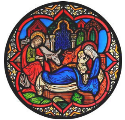
Vitrail autocollant de la Nativité. Notre Dame de Paris.

12h30 Repas partagé dans les salles paroissiales.